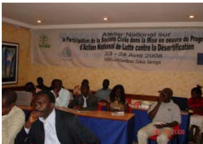
Atelier Drynet, avril 2008, Dakar

Les PANA et les PAN ont certainement des justifications et des approches différentes mais aboutissent pratiquement au même objectif qui est d'améliorer les conditions de vie des populations vulnérables ou démunies affectées par la désertification et les changements climatiques. Le PANA devrait donc renforcer ou relancer les activités déjà initiées dans le cadre des PAN pour parvenir plus rapidement à ses objectifs.